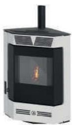
Bianco - White - Weiß Blanc - Blanco