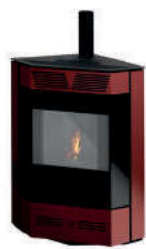
Bordeaux - Burgundy Bordeaux - Bordeaux - Burdeos